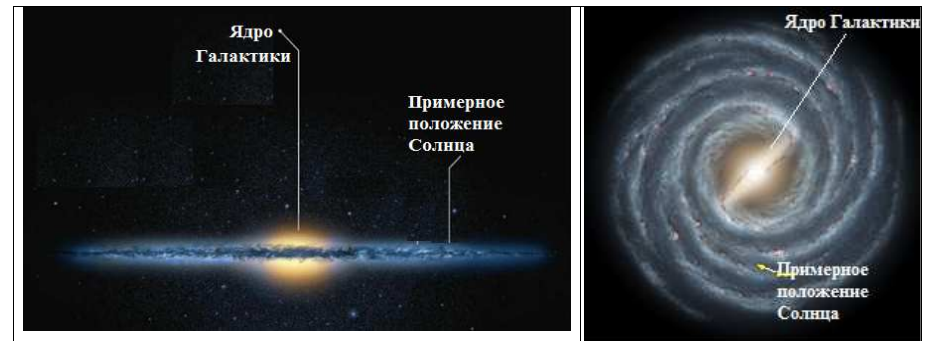
Схематическое изображение нашей Галактики (вид сбоку и вид сверху).

Сегодня учёные считают, что Млечный путь – центральная часть нашей Галактики. Отсюда и саму Галактику стали называть Млечный путь. Солнечная система, а вместе с ней и планета Земля, находятся на краю этого космического мира. Центр же где-то там, далеко от нас. Со стороны Галактика напоминает плоский диск с утолщением посередине. Утолщение в центральной части диска Млечного пути называют Галактическим ядром.