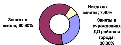
2014-2015 учебный год

Общая занятость учащихся школы дополнительным образованием по сравнению с аналогичным периодом 2013/2014 учебного года выросла на 0,3%, что свидетельствует о постоянной работе классных руководителей 1-11 классов в данном направлении как с учащимися, так и с их родителями.